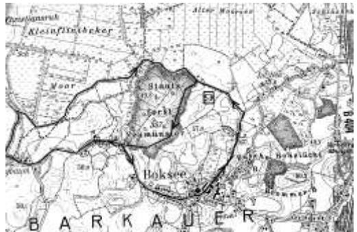
Bokseer Runde (Wanderweg 9)

Anschließend wird ein kleiner Imbiss gereicht.